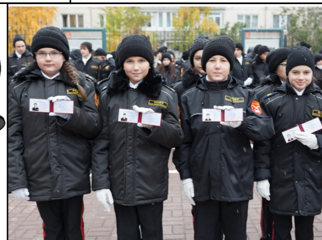
Теперь мы - кадеты !

события для новых учеников нашего учебного заведения. Поэтому на лицах ребят можно было прочесть и экстремальную ответственность, и радостное любопытство. Особенно бурные искры радости читались в глазах родителей: