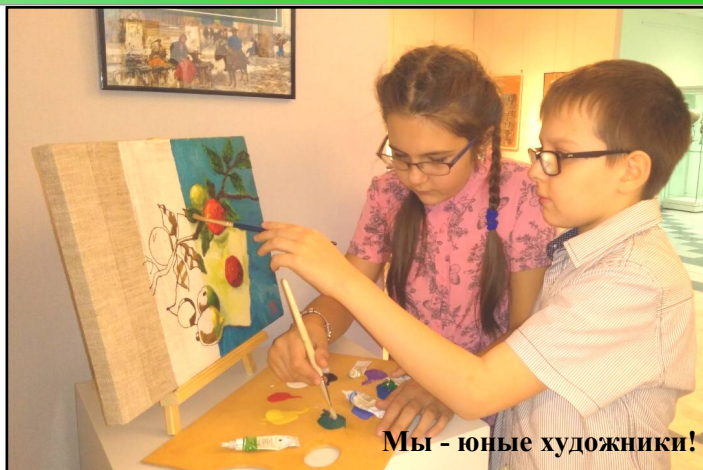
Мы - юные художники!

Екатерина Валиуллина: «Несмотря на то, что это не