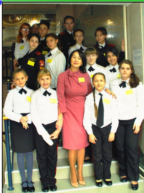
Наша команда юнкоров пресс-центра лица имени Хисматулина В.И.

Все было очень интересно! Все понравилось! Познакомилась с новыми терминами, узнала о составляющих репортажа. Посмотрели наглядный пример одного специального выпуска, выполнили практическую часть (написали сценарий и представили его). Нашу работу похвалили. Сказали: «Вы в танцах!». Мы внимательно выслушали тео-