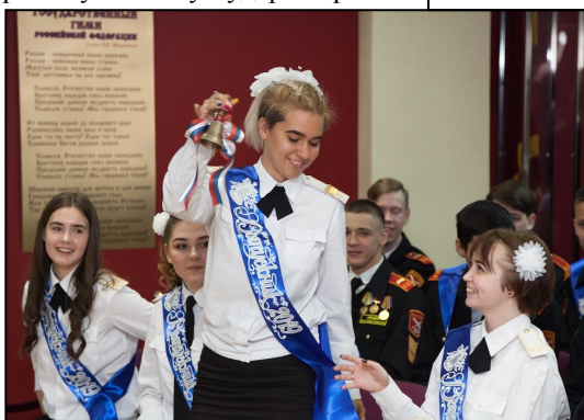
Последний звонок - 2019 прозвенел в руках каждого выпускника

облетел плац, в воздухе повисла звенящая тишина. В лучших традициях лицея, выпускники, преклонив колено, простились со знаменем. Завершился праздник маршем кадетов-выпускников на