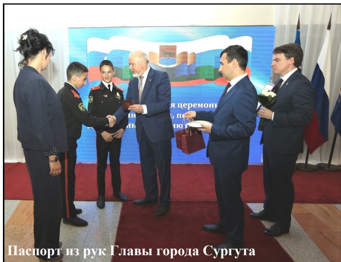
Паспорт из рук Главы города Сургута

ной военно-спортивной игре «Зарница» (2018).