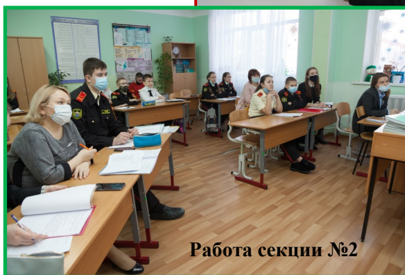
Работа секции №2