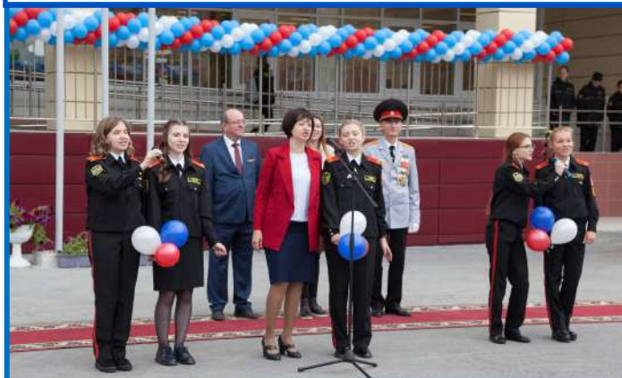
Какой же праздник без песни!