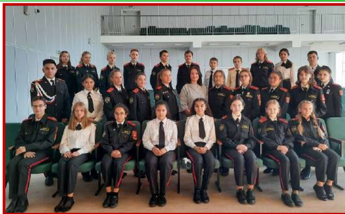
Новый состав редакции в новом актовом зале